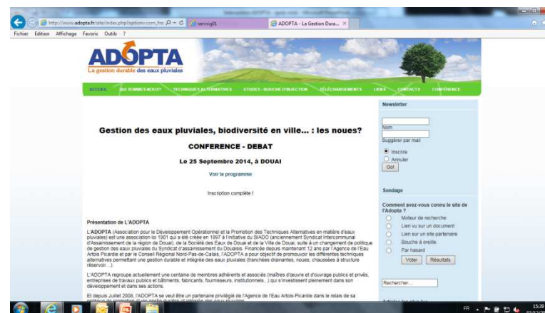
Un site internet www.adopta.fr