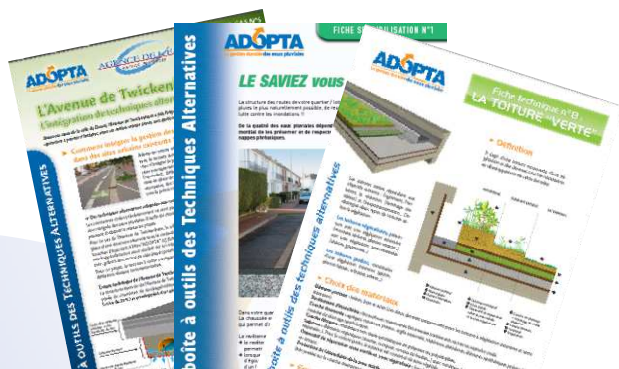
Des publications (fiches techniques, fiches de cas, fiches de sensibilisation...)